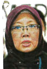
Dr Zaliha Mustafa

Page 1 pic: A senior citizen receiving a dose of Covid-19 vaccine in Kuala Terengganu last year.