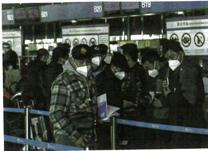
Masked travellers checking their passports as they line up at the international flight check-in counter at Beijing Capital International Airport yesterday.