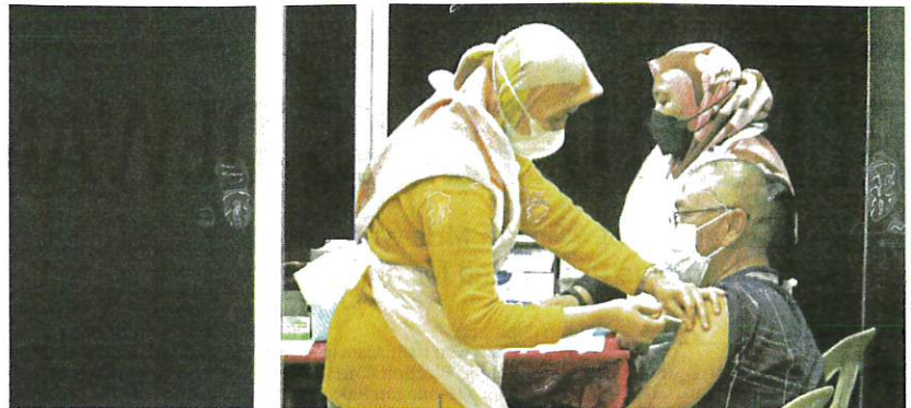
A man receiving a booster shot of the Covid-19 vaccine in Kuala Terengganu last year. Only 1.9 per cent of the Malaysian population have received their second booster dose.